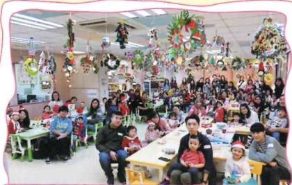
「歡樂聖誕創意小食」親子工作坊