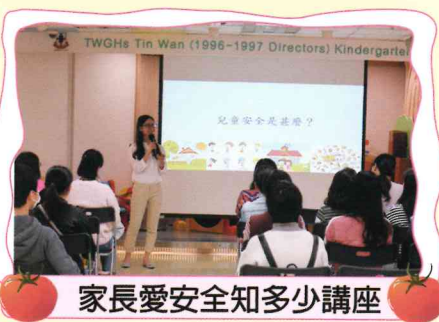
家長愛安全知多少講座