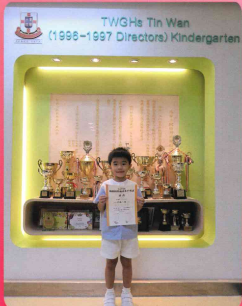
幼稚園普通話水平考試