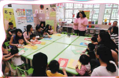
新生導覽會及新生遊戲日