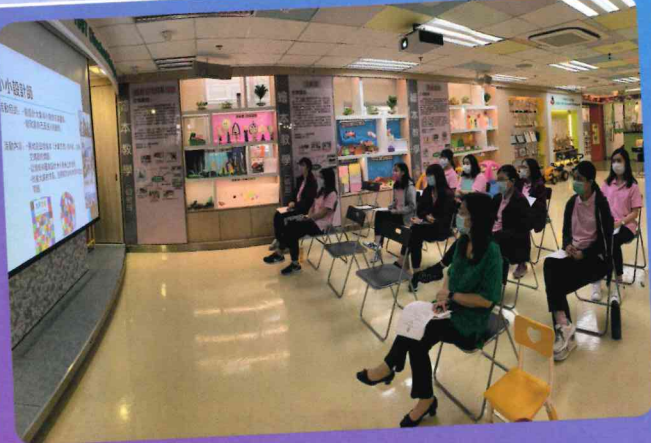
「電子同儕觀課計劃」