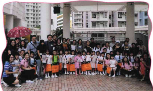
東華三院賣旗活動