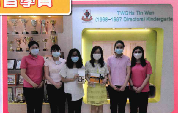
香港教育大學幼兒教育高級文憑 (二年級)實習學員