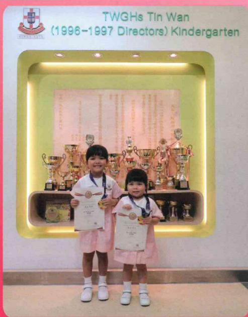
香港兒童朗誦公開賽2020