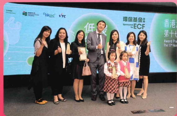
第十七屆香港綠色學校獎 最傑出表現獎(幼兒學校組)