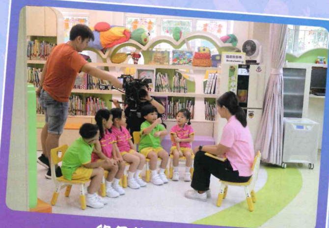
綠色校園拍攝花絮