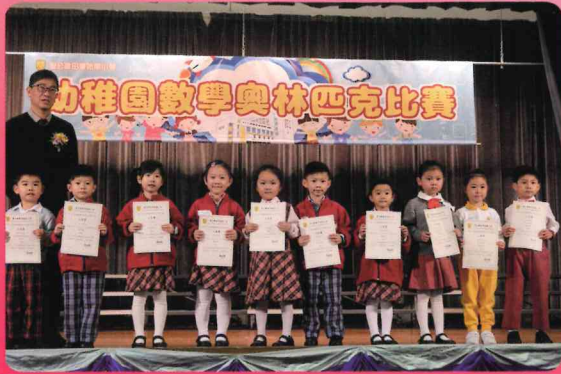
幼稚園數學奧林匹克比賽