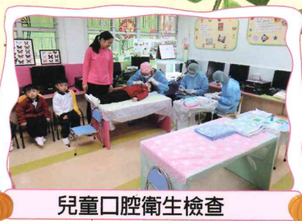
兒童口腔衛生檢查