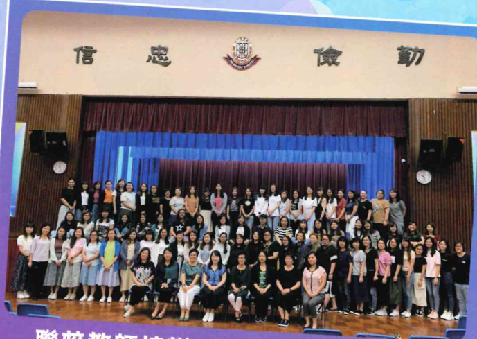
聯校教師培訓「自由遊戲」工作坊