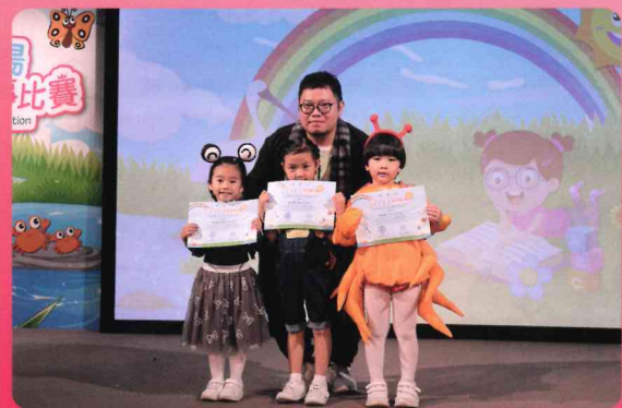
濕地公園說故事比賽 榮獲幼兒組亞軍