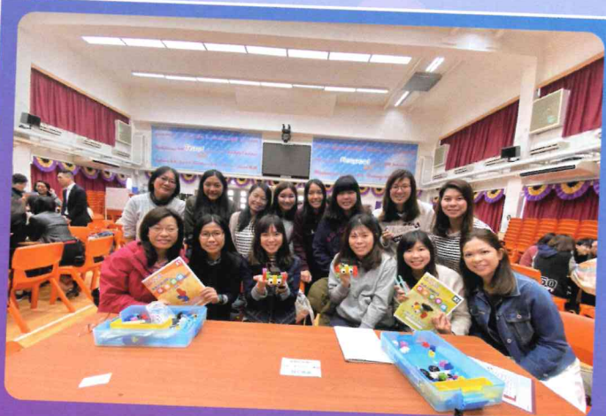
聯校教師培訓「日本積木課程」