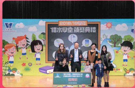
珍惜點滴親子填色比賽2019