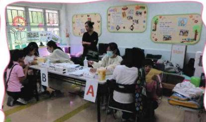
季節性流行性感疫苗(第1劑)