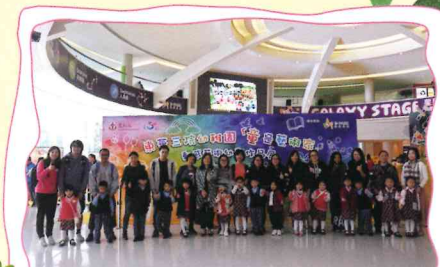
童是藝術家「動感藝術幼兒作品展」