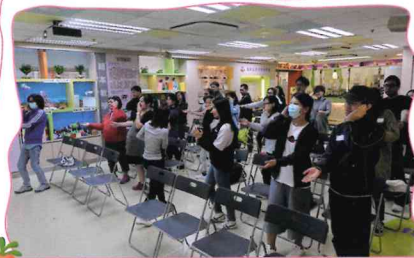
「家·長·愛」激發大腦潛能講座