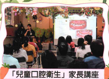
「兒童口腔衛生」家長講座