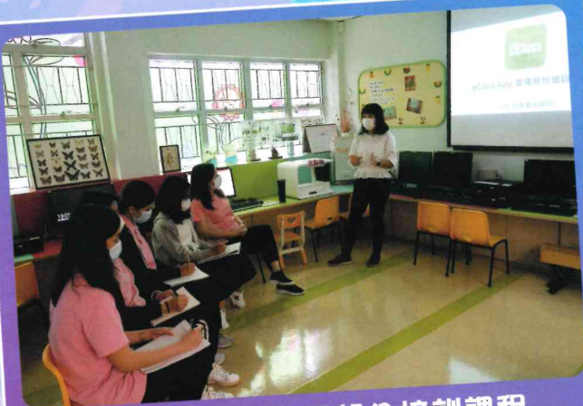
eClass App 管理部分培訓課程